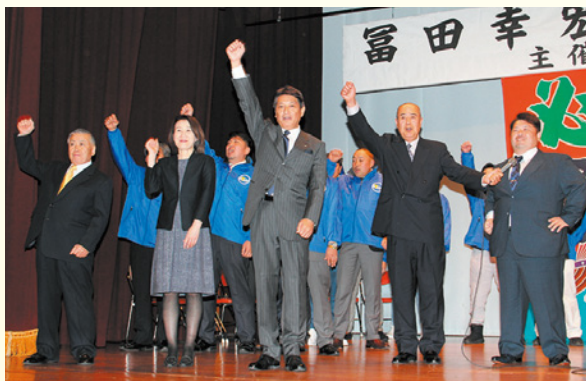
ガンパローコールで一致団結