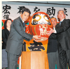
同級生が必勝だるま寄贈

でのガンパローコールと、選挙に向けての団結力が高まった事に、計り知れないほどの勇気を頂きました。 この度の「励ます会」の中で、私自身が12年前の初当選した際の記憶を思い出し、「初心にかえること」を、改めて皆さんに気付かせて頂きました。その思いを心の中において、「泰然自若」で選挙に向けて頑張ってください。 引き続きのご指導とご協力をお願い申し上げます。