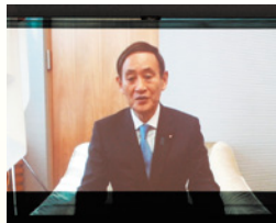
菅義偉 内閣官房長官よりビデオ応援メッセージ