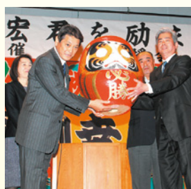
同級生が必勝だるま寄贈