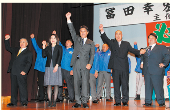
ガンバローコールで一致団結