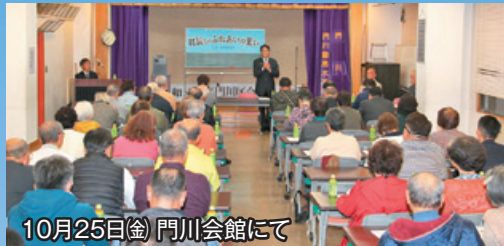
10月25日(金) 門川会館にて