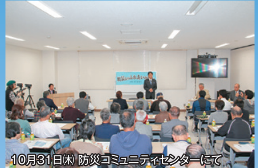
10月31日(木) 防災コミュニティセンターにて