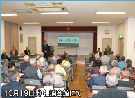
10月19日(土) 福浦会館にて