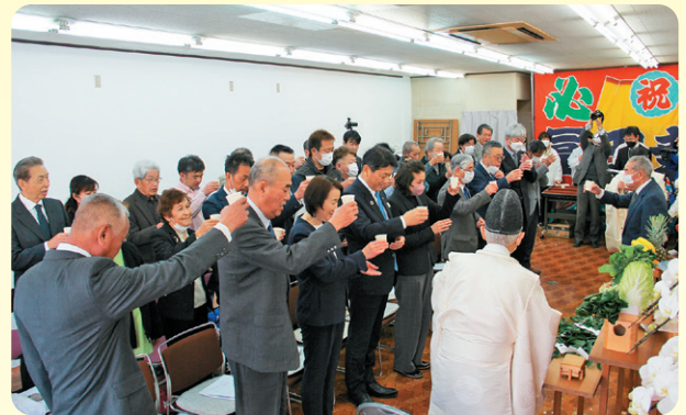
「富田後援会事務所開所式」は、厳かな神事が執り行われ、張りつめた空気の中、選挙の始まりに身が引き締まります。